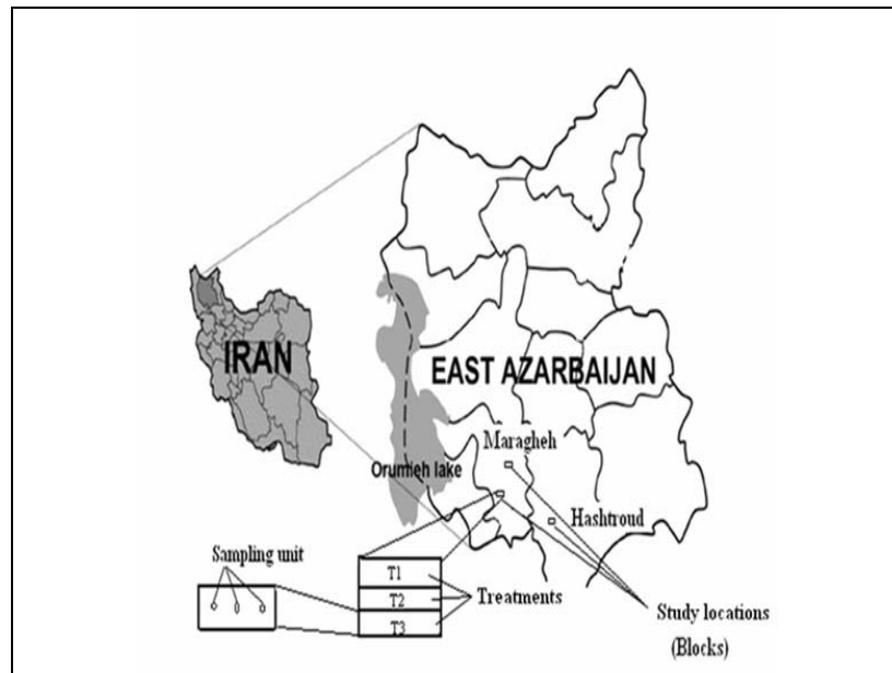
شکل ۱- موقعیت جغرافیایی مکان ها و تیمارها

نظر اقتصادی نیز توجیه داشته باشد، در دراز مدت به تخریب خاک و اراضی دیمزارها منجر خواهد شد.