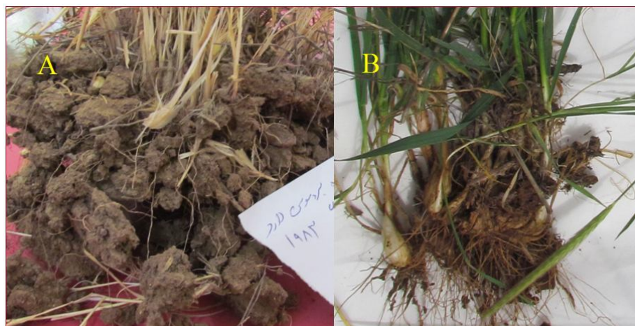
شکل 2- تأثیر سیستم متراکم گیاه مرتعی بروموس با کلاس خوشخوراکی I (A) و جو وحشی با کلاس خوشخوراکی II (B) بر افزایش معنی‌دار خاکدانه‌های درشت، نفوذپذیری و پایداری خاک مراتع تحت قرق در سال پنجم.

کاهش کلاس و رتبه محدودیت خاک بر اساس شاخص‌های جرم مخصوص ظاهری، کربن آلی، نسبت خاکدانه‌های درشت و شاخص پایداری بیانگر ارتقاء کیفیت خاک و نقش مؤثر آن در تغذیه، نگهداری رطوبت،